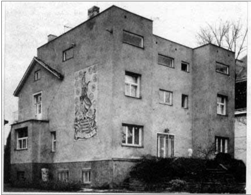
رینوینی هونری مودیرن... دینوینی هونری مودیرن...